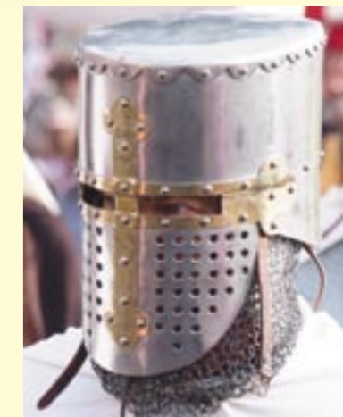
LA COMPAGNIA D'ARME "SANCTO ERAMO" Tor Vaianica

La Compagnia D'Arme Sancto Eramo, associazione storico, sportiva, per la diffusione dell'arte e della cultura italiana, nasce per rievocare, periodi storici che hanno segnato la storia del Territorio, con particolare attenzione al periodo medievale dei Cavalieri Templari e Secolari che nella Maggiora territoriale di Pomezia furono presenti ed operarono.