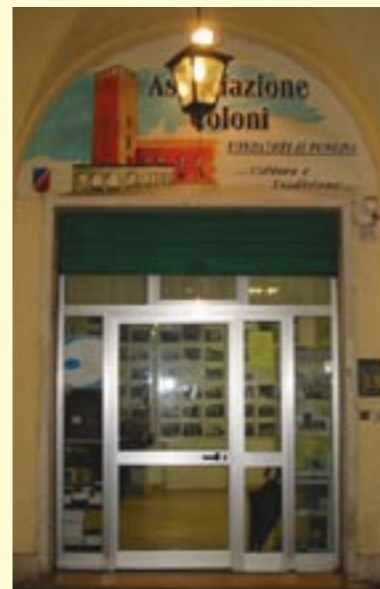
ASS. COLONI FONDATORI DI POMEZIA