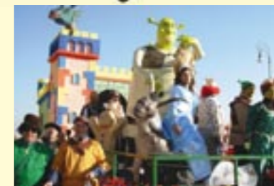
COMITATO DI QUARTIERE "NUOVA LAVINIUM"

Il Comitato di quartiere Nuova Lavinium è nato il 21 giugno del 1999, per volontà di un gruppo di cittadini di Pomezia, residenti nell'omonimo comprensorio, desiderosi di farlo emergere dal grigiore in cui rischiava di sprofondare.