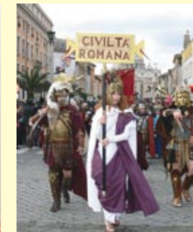
ASS. CIVILTA' ROMANA

"CIVILTA' ROMANA" è un progetto sociale e culturale, costituitosi in associazione il 7 gennaio 2010 a Roma. Nata dall'interesse e dalla passione per la storia romana dei propri soci fondatori, provenienti da diversi e prestigiosi gruppi di rievocazione storica della Roma antica, con esperienza quindicennale, CIVILTA' ROMANA è un'associazione culturale senza fini di lucro, di ricostruzione, rievocazione storica e di archeologia sperimentale della storia romana. L'idea alla base dell'associazione è rappresentata dalla volontà di contribuire alla conoscenza storica del periodo romano e di voler valorizzare la cultura, l'arte, la tecnica, e l'organizzazione della civiltà romana in Italia e nel mondo. Il nome CIVILTA' ROMANA è stato assunto dall'associazione poiché riassume con semplicità il tema e lo studio trattati, è di facile ricordo e richiamo ai valori ed alla Storia dell'Urbe. A simbolo dell'associazione è stata presa l'effigie della DEA ROMA, emblema universale della cultura e della civiltà di Roma (raffigurante tutti gli aspetti sociali, culturali, tecnologici, militari, religiosi ed artistici del popolo romano).